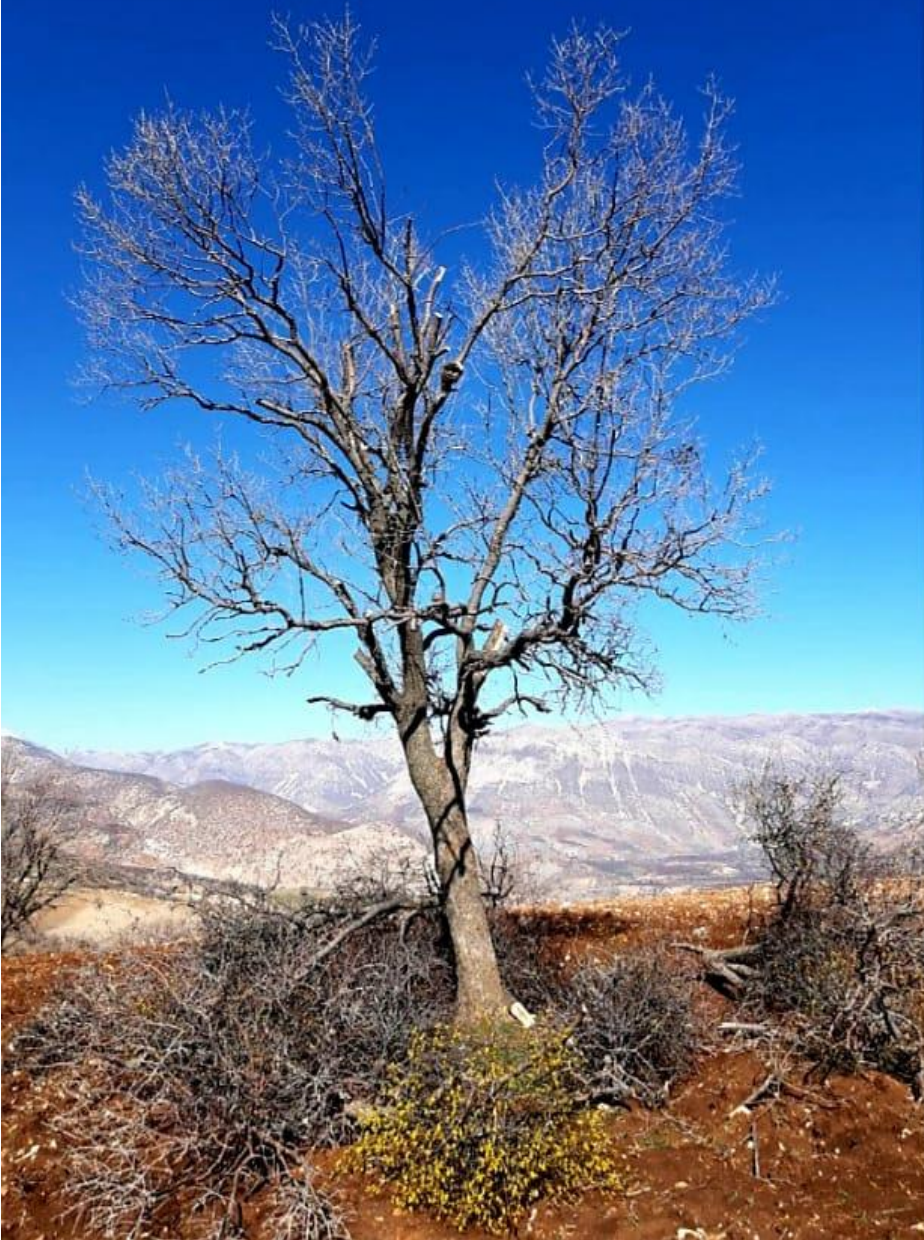
بعد از اجرای مبارزه